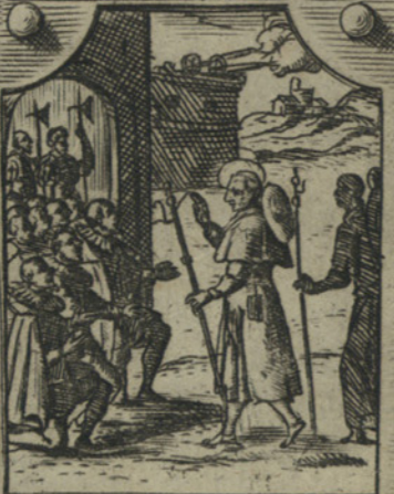
Fa à piedi lunghi pellegrinaggi, massime à Turino per visitar la Sacra Syndone.