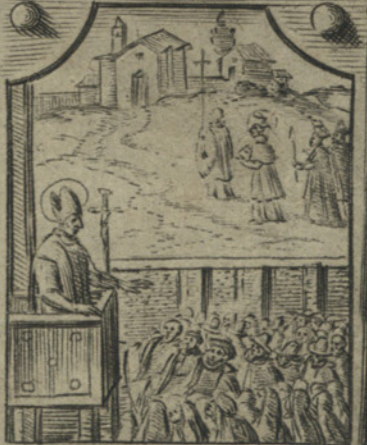
E fatto visitatore Apostolico nella sua Prouincia et paesi d'heretici et li conuerte alla Fede Cattolica