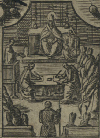
Celebra molti Concilij per riformare il suo Clero, e popolo :