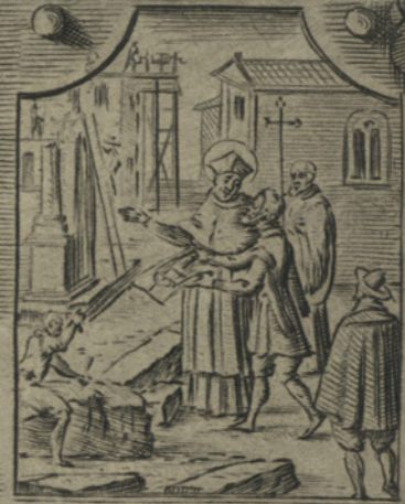
Edifica magnifiche fabbriche di Chiese e Case Ecclesiache per accrescere il culto diuino