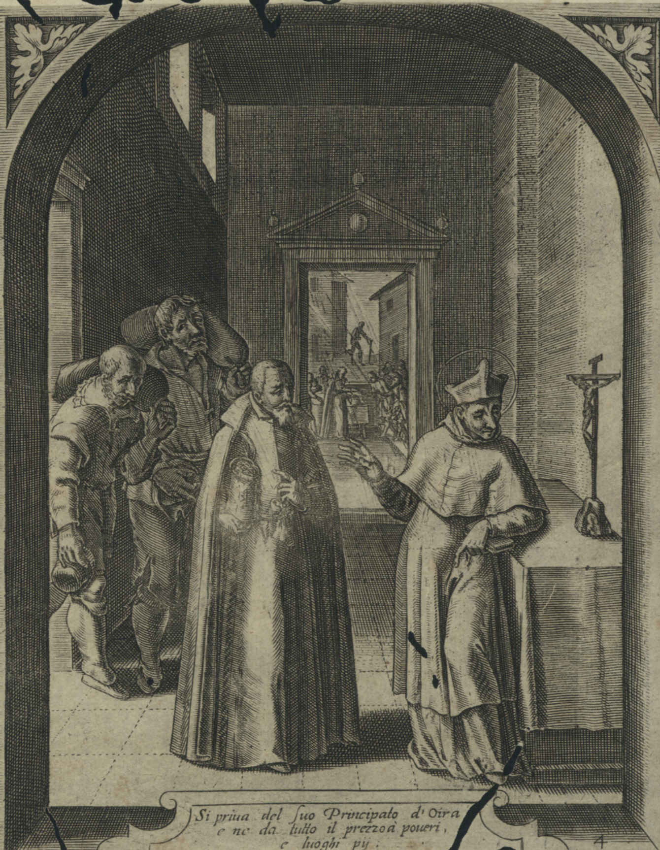
Si priua del suo Principato d' Oira e ne da tutto il prezzo a poveri, e luoghi pij.