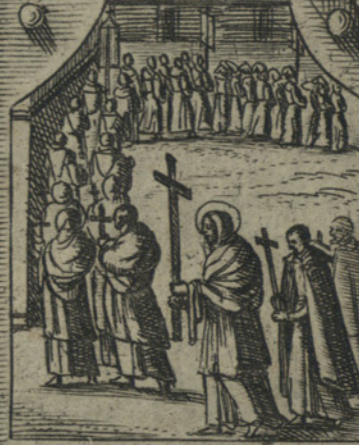
Celebra scalzo Processioni, con una sione al Collo, mueno un piede serito p liberar Milano dalla peste.