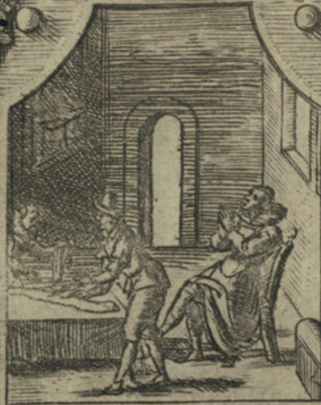
Sana dal male del Cancero Aurelia dell' Angeli giudicata incurabile