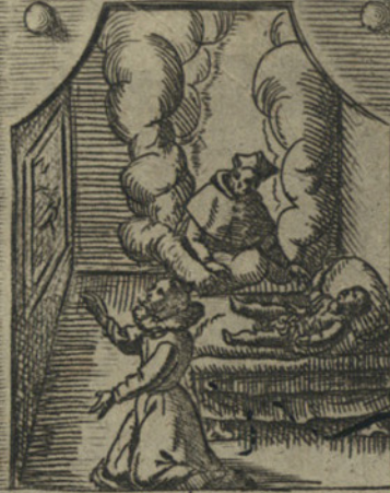
Apparendo a Melchiorre Bariola, lo sana d'una apertura incurabile