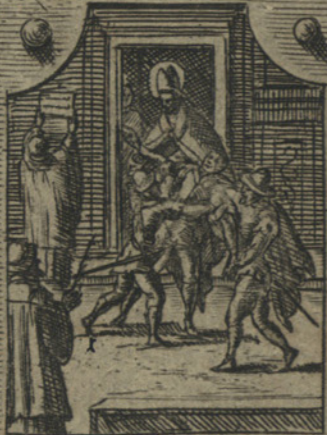
Disfende intrepidamente l'im- munita Ecclesiastica etiamdio, con pericolo della propria vita