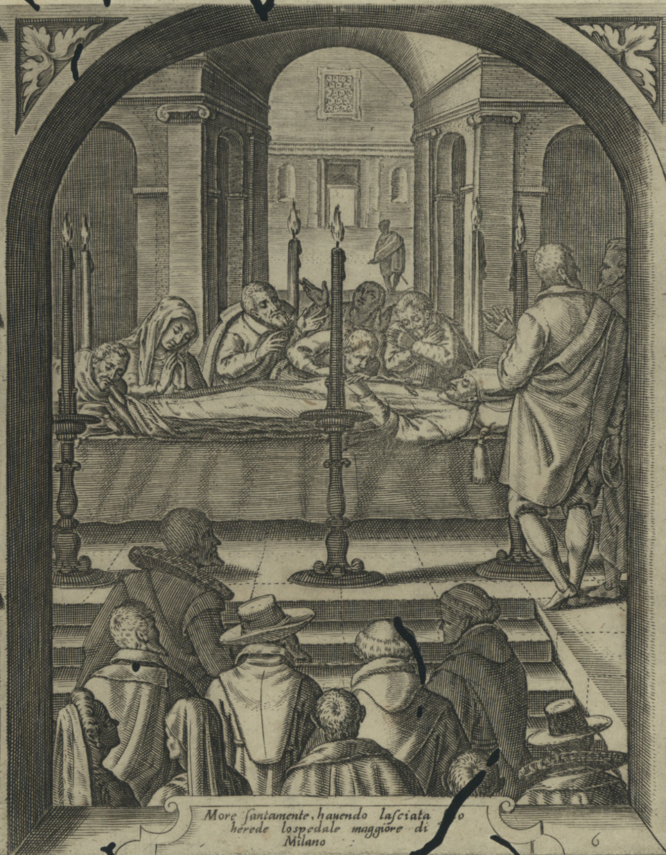
More santamente, havendo lasciata herede l'ospedale maggiore di Milano