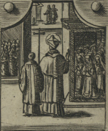
Erge Monasteri di Cappuccini, Collegi di virgini, et luoghi pii.