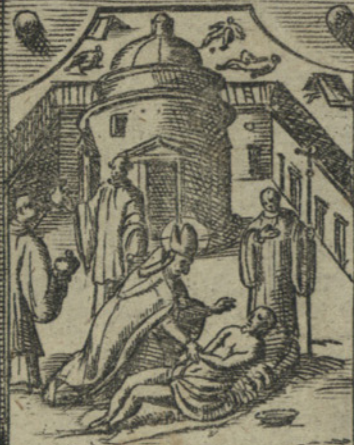
Visita souente gl' Infermi di peste, e ministra loro i santi Sacramenti.