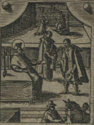
Rinuntia molte dignita nelle mani del Papa, e, titoli per 60 mille scudi d'entrata