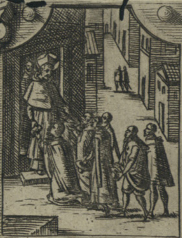
Fonda la Congregatione delli Oblati, e molti Collegi, et Seminarj di giovani nella sua Chiesa,