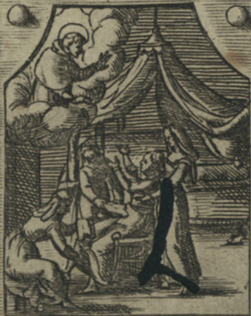
Aiuta Clementia Criuella in parto a moriuu adosso, la Centura