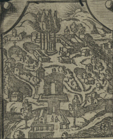
Si prepara alla morte nel monte di varallo con aspra penitensa.