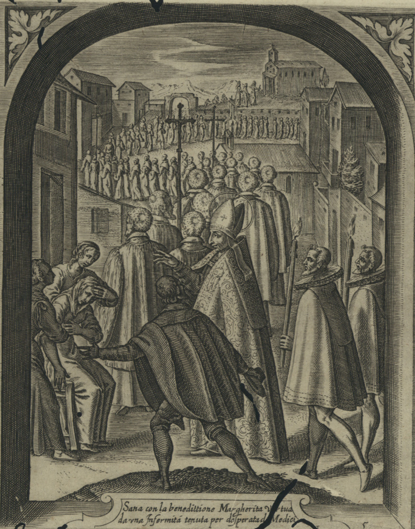
Sana con la beneditione Margherita Virtua da vna infermità tenuta per desperata da Medici