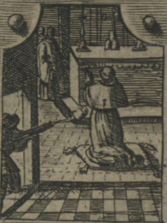
Peruoler riformare li Humiliati e colpito d'una archibusata, che non l'offende :