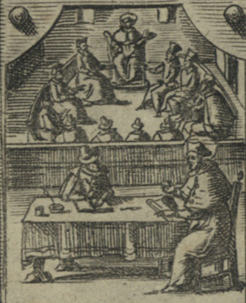
Fa' consiglio per servire a gl' appestati, e col far Testamento si dispone alla morte.