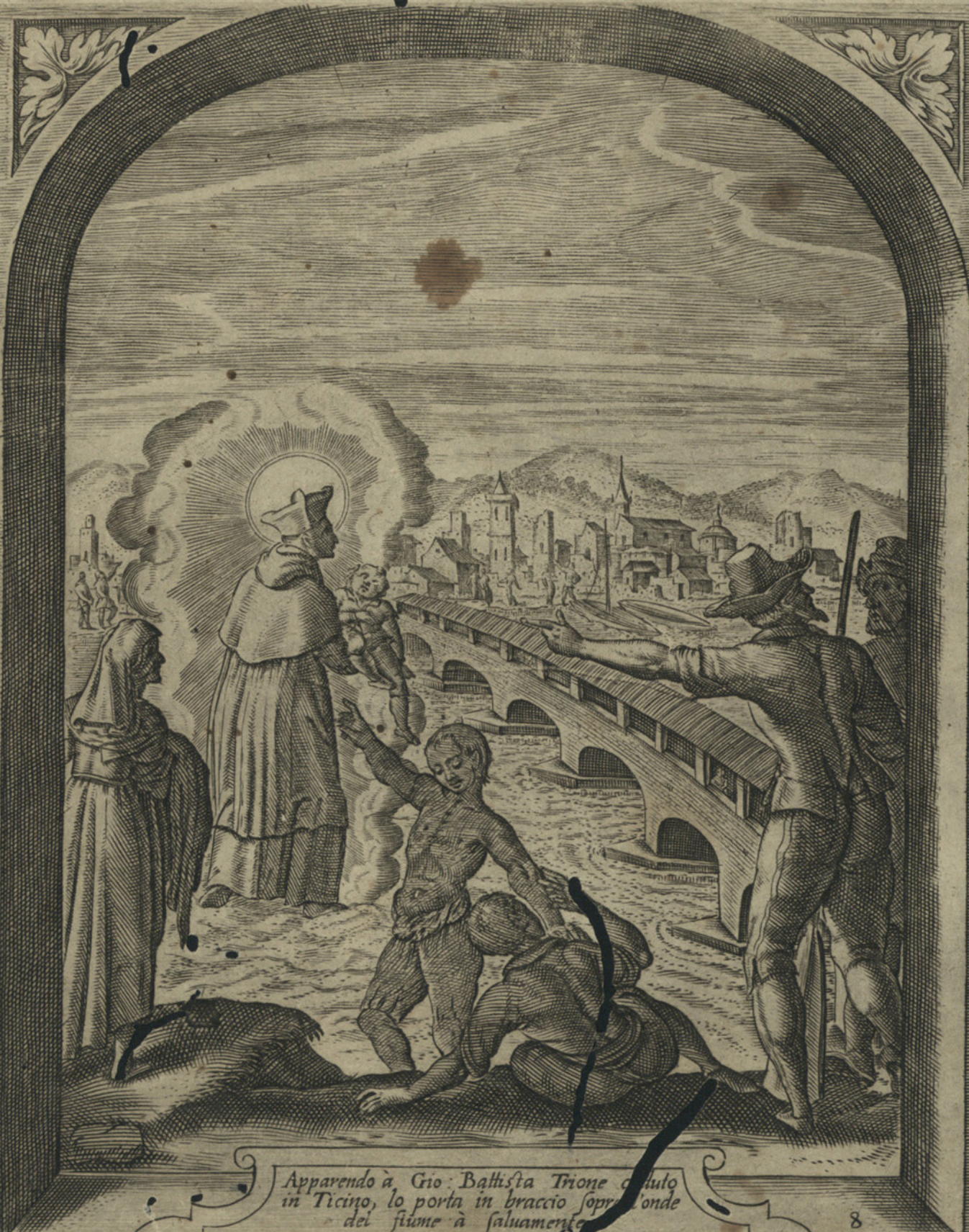
Apparendo a Gio: Battista Trione caduto in Ticino, lo porta in braccio sopra l'onde del fiume a salvamento