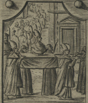
Per far riuere molto da Popoli le reliquie de Santi ne celebra diuersi solenne traslationi