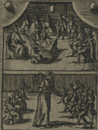
Pianta le scuole della Dottrina Christiana, con una Congregat. generale in Milano