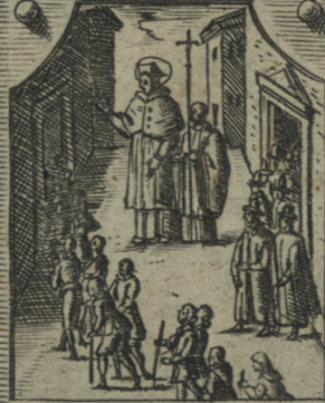
Fonda in Milano un Hospital di poveri mendicanti et un Collegio di studenti a Pavia.