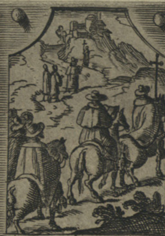
Andando spesso per valli e monti come buon Pastore visita, e pasce tutte le sue piccorelle :