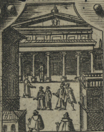
Istituisce il Collegio di Brera, con le scuole pubbliche, et erge in Milano altri Collegi di Gesuiti e Theatini.