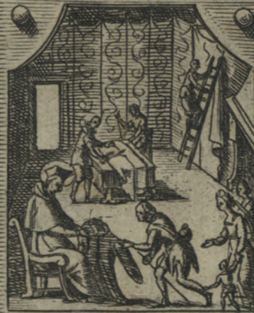
Spoglia tutta la casa sua, e guardarobba per pascere, et vestire li pouerelli.