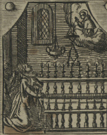
Beatrice Crespi ottiene la sanita d'una piaga nel petto Incurabile