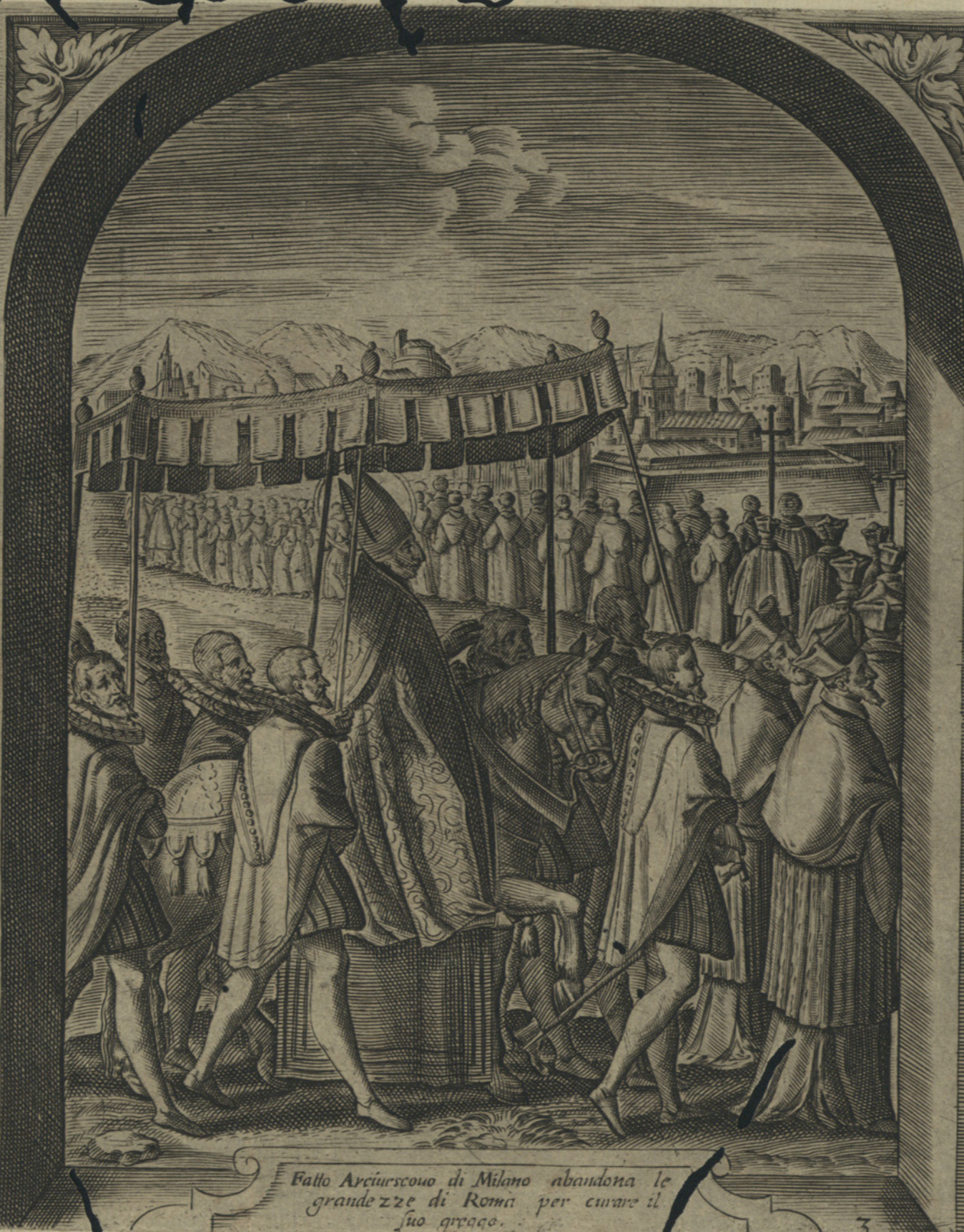
Fatto Arcivescouo di Milano abandona le grandezze di Roma per curare il suo gregge.