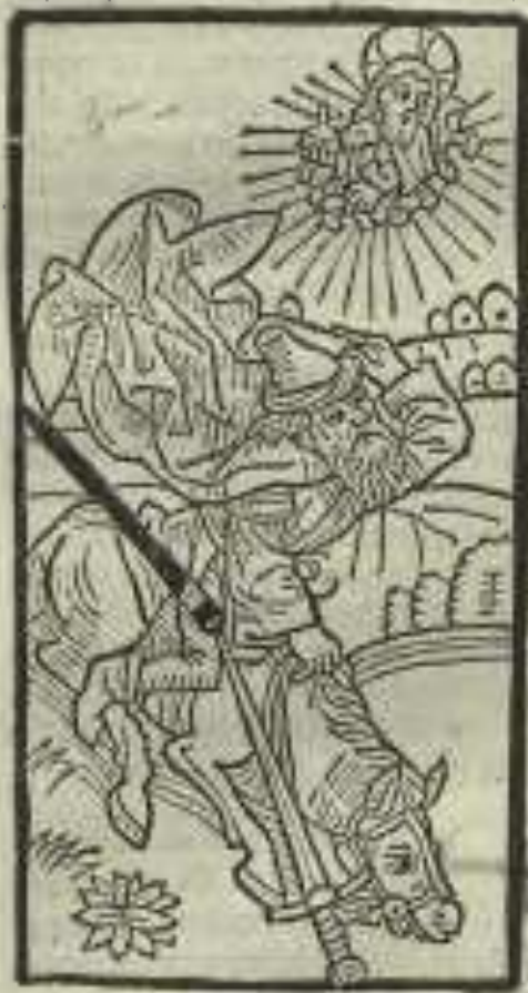
De appetenda discretione.

ne forte inuacuum currem aut cucurrissem. Quis ergo tam presumptor et cecus sit qui se audeat suo iudicio ac discretioni committere. cuius vas electionis indignuisse coapostolorum suorum se collatione testetur. Unde manifestissime comprobatur. ne a domino quidem viam perfectionis quē empiam promereri. qui habens vnde valeat erudiri. doctrinam seniorum. vel instituta contempserit. parripēdes illud eloquium quod oportet diligentissime custodiri. Interroga patrem tuum et annuntiabit tibi. seniores tuos et dicent tibi.