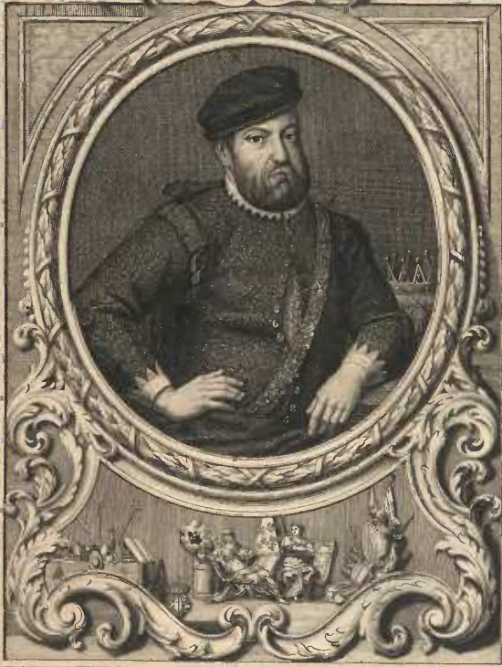
G. F. D. d. r. i. c. s. c. u. l. p. t. o. r. R. e. g. i. u. s. i. n. v. e. n. i. t. e. t. s. c. u. l. p. s. e. t. 1742.