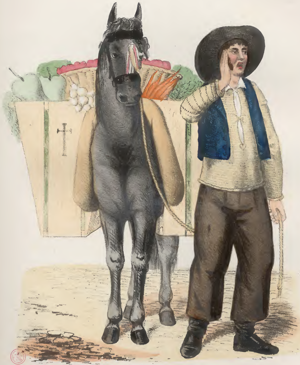
1051 Hortelão vendendo ortaliça em Lisboa