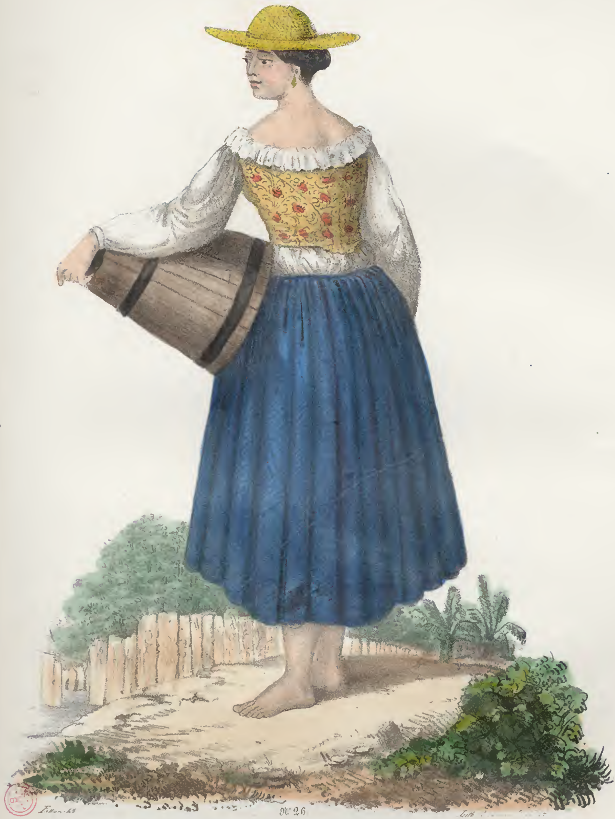
Mulher da. Mha do Fico