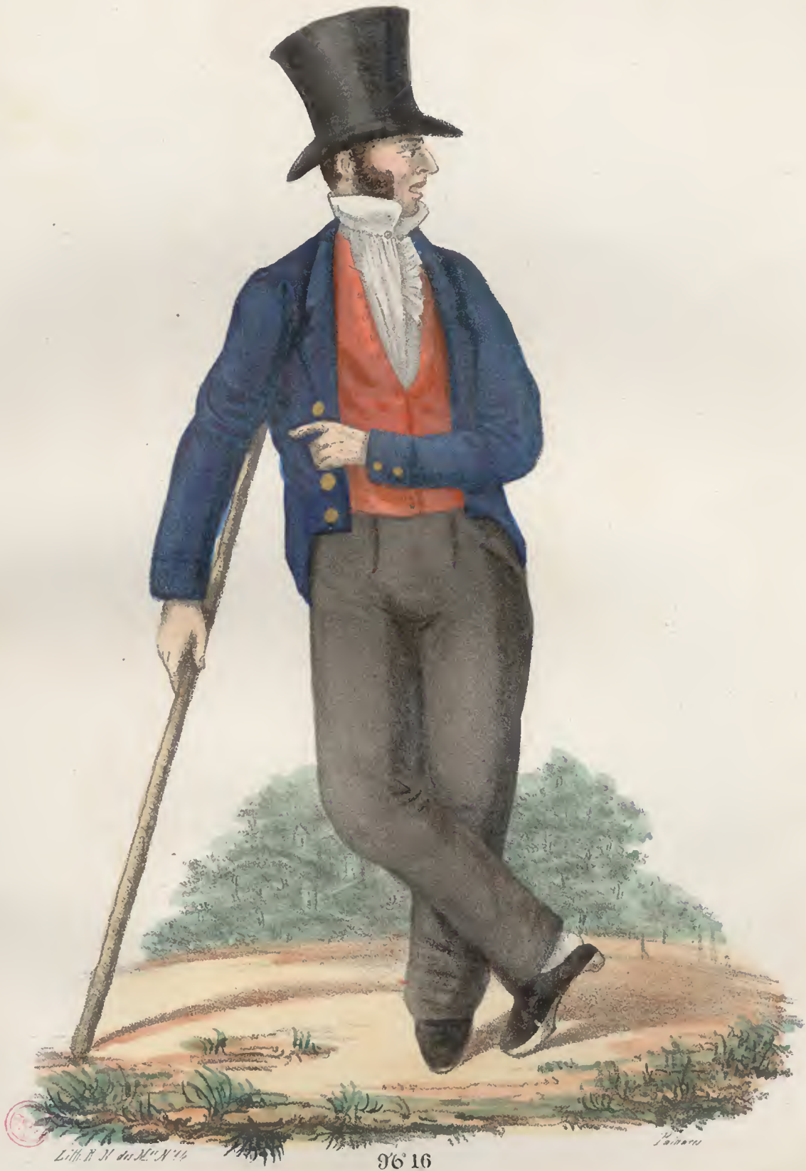
Homem da Cidade de Braga.