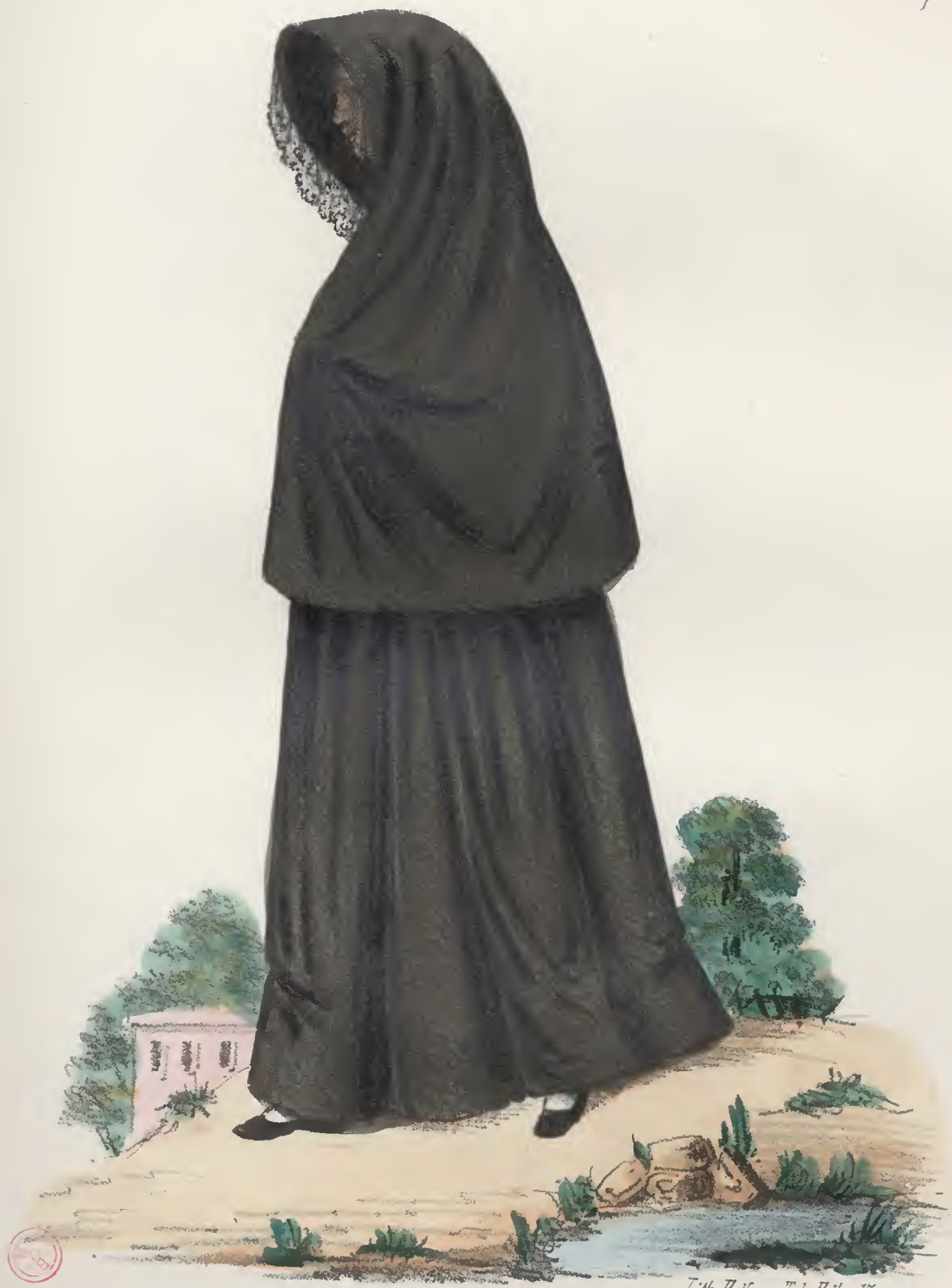
N o 48 Mulher de Sortalegre