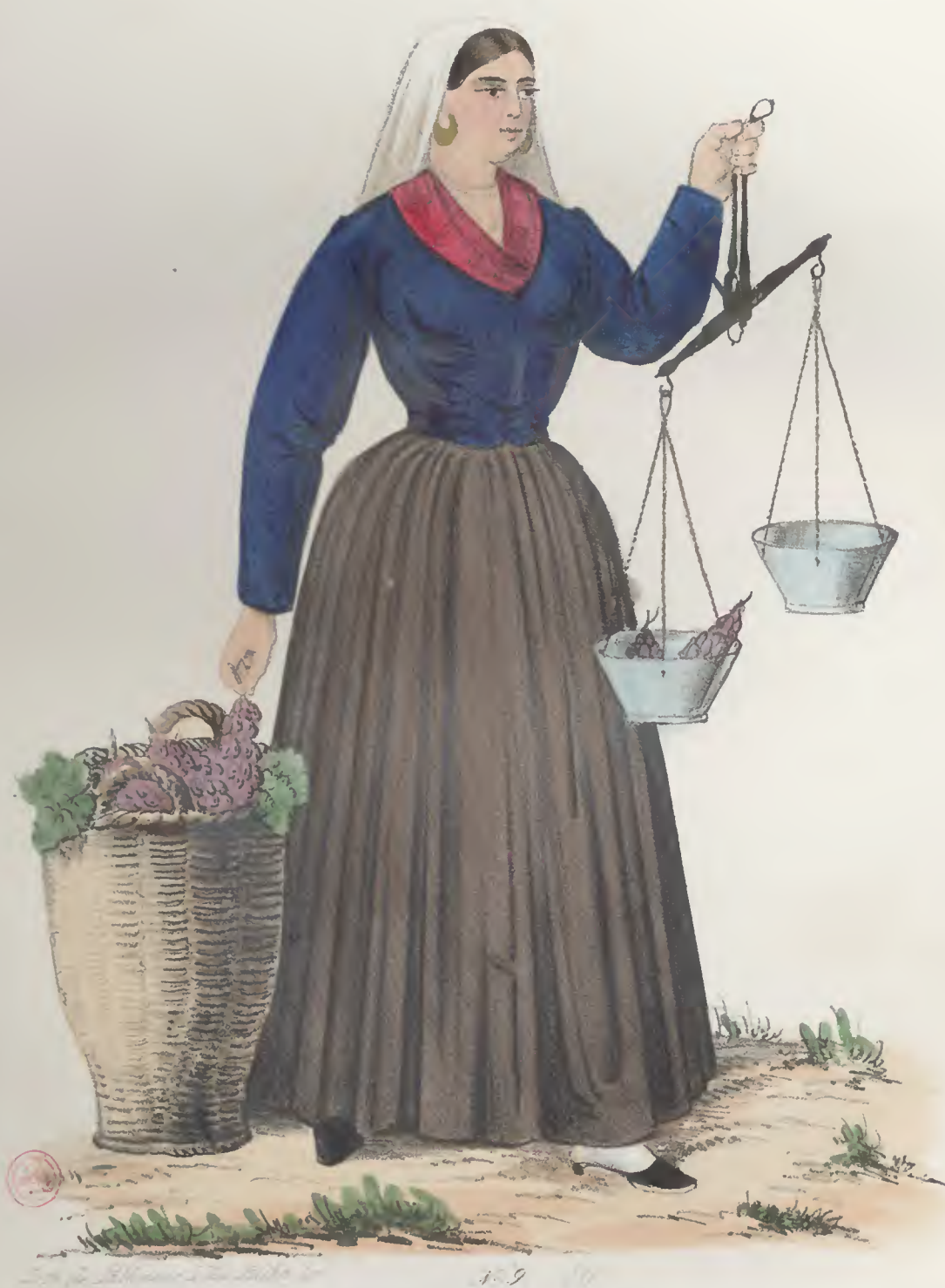
Mulher da cidade de Fozte vendendo uvas de cima de Douro.