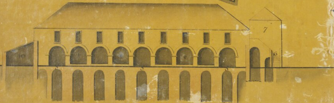
Secção de C.D.