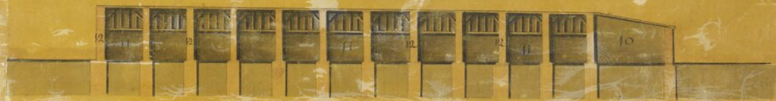
Secção de G. H.