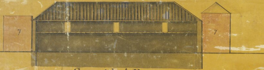
E Secção de A.B.