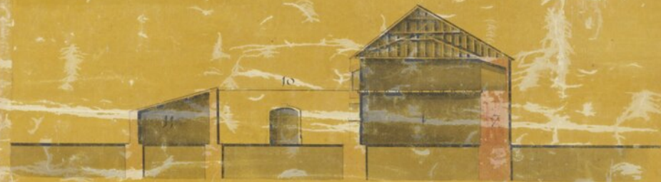
Secção de E.F.