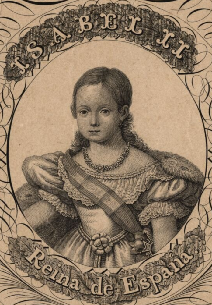
I. S. A. B. E. L. I. I.