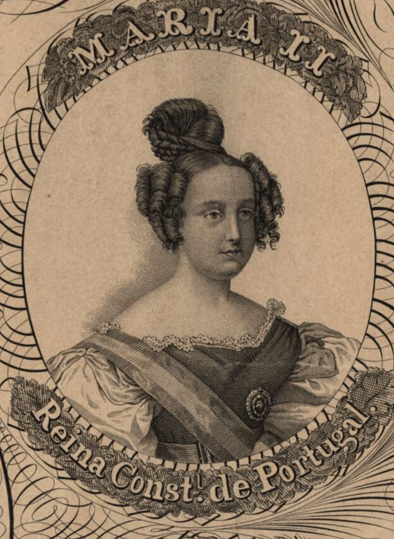
M. A. R. I. A. II