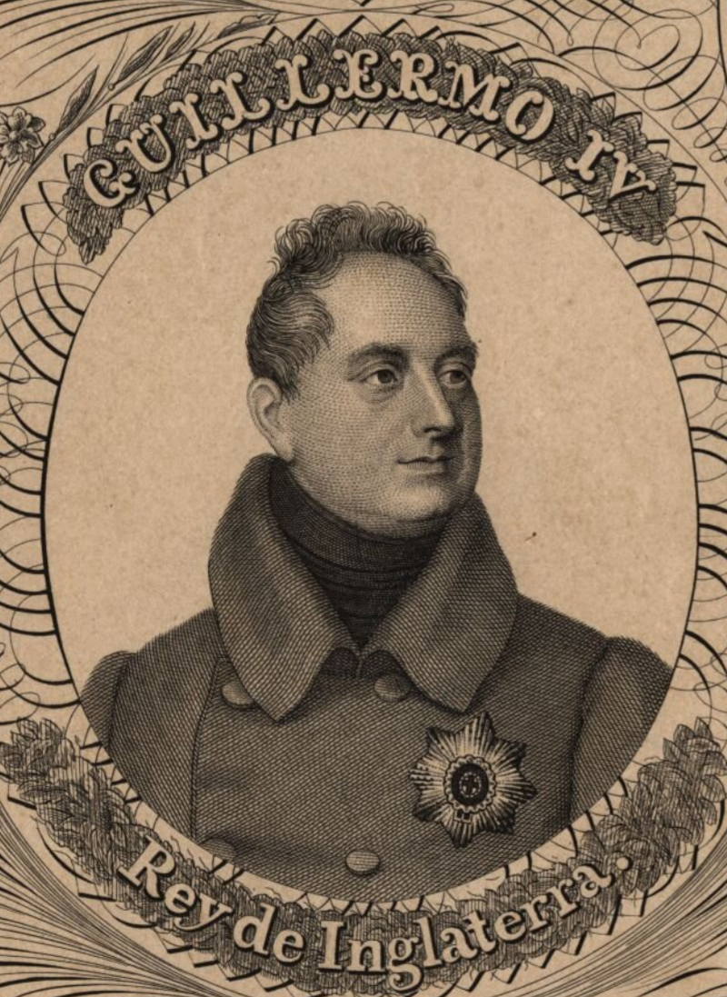
W. I. L. L. I. A. M. I. V.