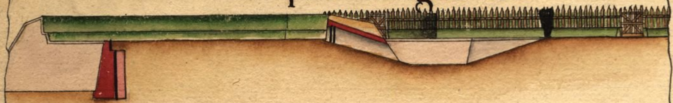
Profil pris sur la ligne NO