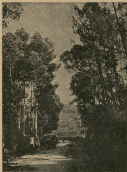
Fig. 2 — Começo da Mata da Senhora da Assunção