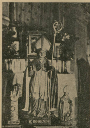
Fig. 4 — Imagem e relicário de S. Rosendo