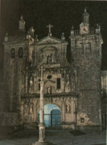
GUARDA — CATEDRAL (Sig. XVI y XVII)