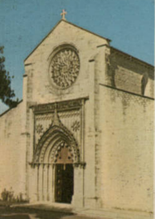
BEJA — IGLESIA MATRIZ