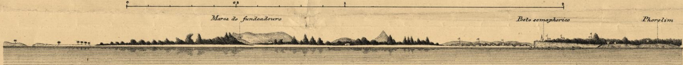
Vista tirada do fundeadouro ao qual serve de marca o arvoredo alto da barra de Loge encobrendo a fortaleza.